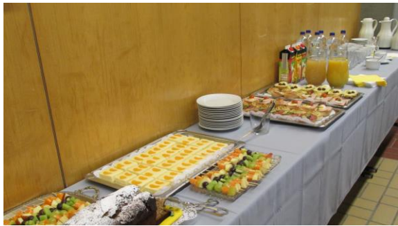
Catering der 10. Klasse.

Der Wettbewerb wurde von der Gruppe Soziales aus der 10. Klasse hervorragend bewirtet. Ein herzliches Dankeschön dafür.