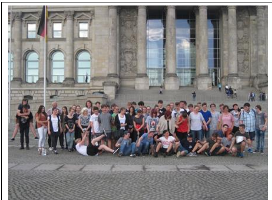
Der Versuch, ein Gruppenbild zu knipsen.

Gegen 7:45 Uhr haben sich alle an der Schule getroffen, um 8:00 Uhr ging die Reise los. Die Busfahrt war sehr angenehm und ziemlich lustig. Alle hatten gute Laune und freuten sich auf Berlin! Nach einer kurzen Pause in Leipzig ging die Fahrt auch schon weiter! Als wir ankamen bekamen alle ihre Koffer, die Zimmereinteilung und Zimmerkarte. Noch am selben Tag sind wir mit der S-Bahn zu dem Paul-Löbe Haus gefahren, weil dort ein