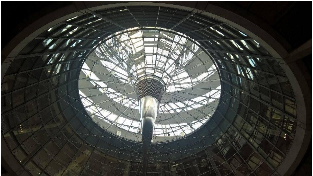
Die Kuppel von unten