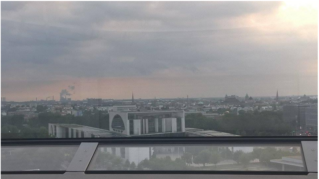
Wunderschöner Ausblick auf Berlin