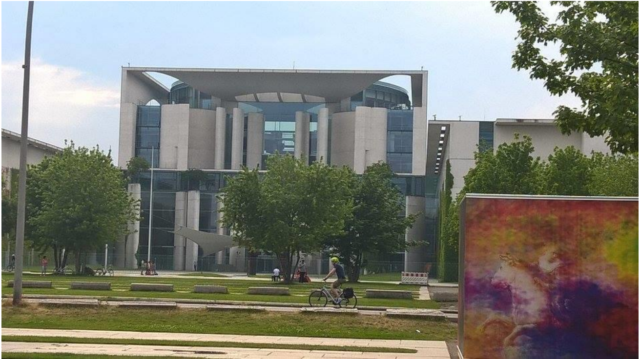
Das Paul-Löbe Haus in Berlin