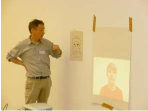
Erklären der Vorgehensweise