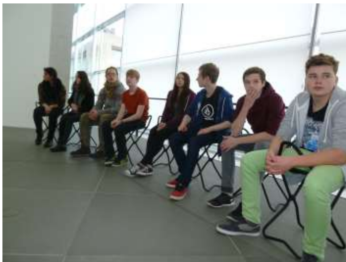
Bildbetrachtung: Schüler betrachten das Portrait von Julian Opie