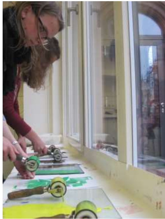
während des Druckens